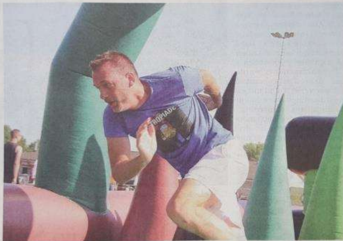
Der Spiel- und Spaß-Wettkampf Castropiade kommt wieder. Auch 2023 soll er Anfang September stattfinden.

Im Unterschied zum bisherigen Veranstaltungsformat werde es dann zusätzlich einen Gesundheitsmarkt geben, kündigt sie an. Dieser biete „Unternehmen eine hervorragende Möglichkeit, ihr Leistungsangebot zu Themen wie